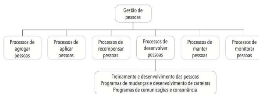
Figura 2 – Processos de desenvolver pessoas.

Ainda de acordo com a literatura pesquisada, é possível notar que treinamento e desenvolvimento são formas distintas e complementares de adequação ao cargo, mas desenvolvimento apresenta um conceito amplo de transformação. Segundo Dutra (2017) o resultado esperado do processo de desenvolvimento de pessoas engloba o aproveitamento da educação formal, experiências de trabalho, transformação comportamental, desenvolvimento de habilidades e aplicação talentos que ajudem o funcionário a se preparar para futuros empregos ou funções, e a para organização representa contar com profissionais capacitados para atuar na função atual e também capazes de promover e se adaptar a mudanças.